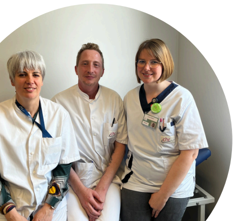
L'ÉQUIPE PRÉ HOSPITALISATION

Nous vous suggérons de prendre des renseignements avant votre séjour sur les possibilités de soins infirmiers à domicile proche de chez vous. Votre mutualité pourra vous guider dans vos démarches. L'assistante sociale du service reste à votre disposition si vous souhaitez la rencontrer.